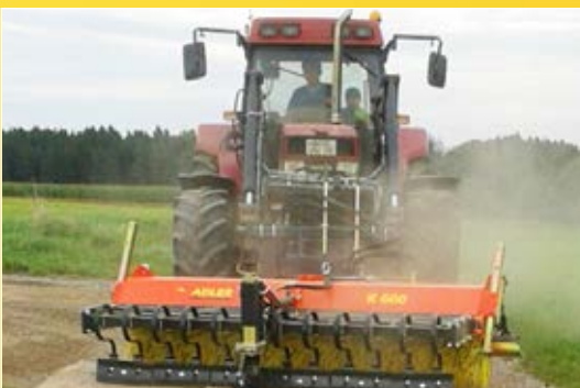
Kratzvorrichtung K 600 ohne Schmutzsammelbehälter