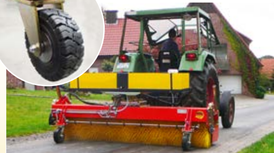
Geeignet für den Traktor im Heck- und Frontanbau