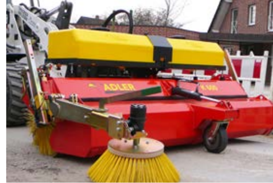
Seitenkehrbesen und Wassersprüheinrichtung als Option