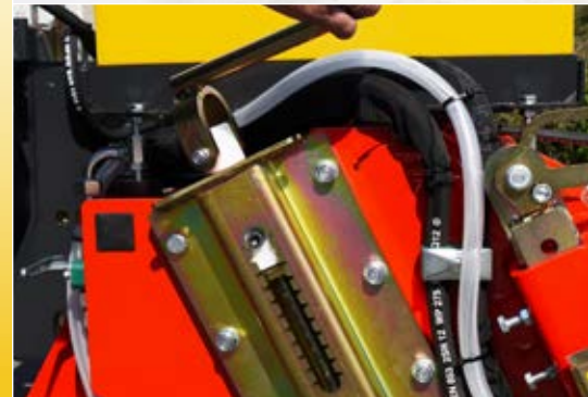
Bürste stufenlos einstellbar