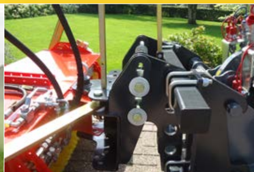
Hofladeranbau mit 3D-Niveausgleich