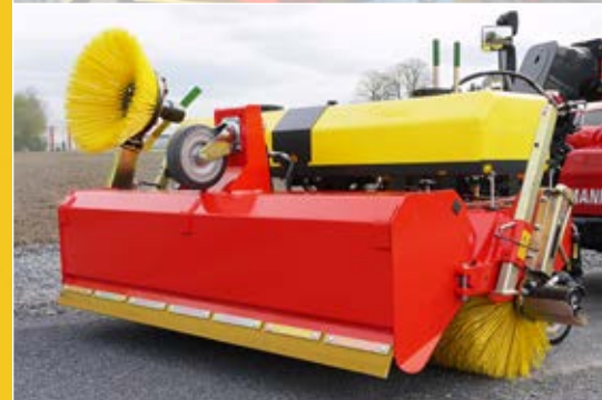
Freikehrmodus, hydraulische Behälterentleerung und drittes Stützrad am Sammelbehälter