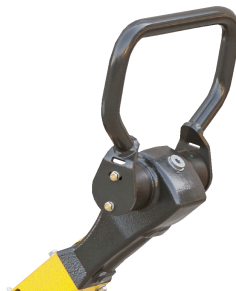
Präzise und sicher bedienbar Komfort-Hebel-Steuerung