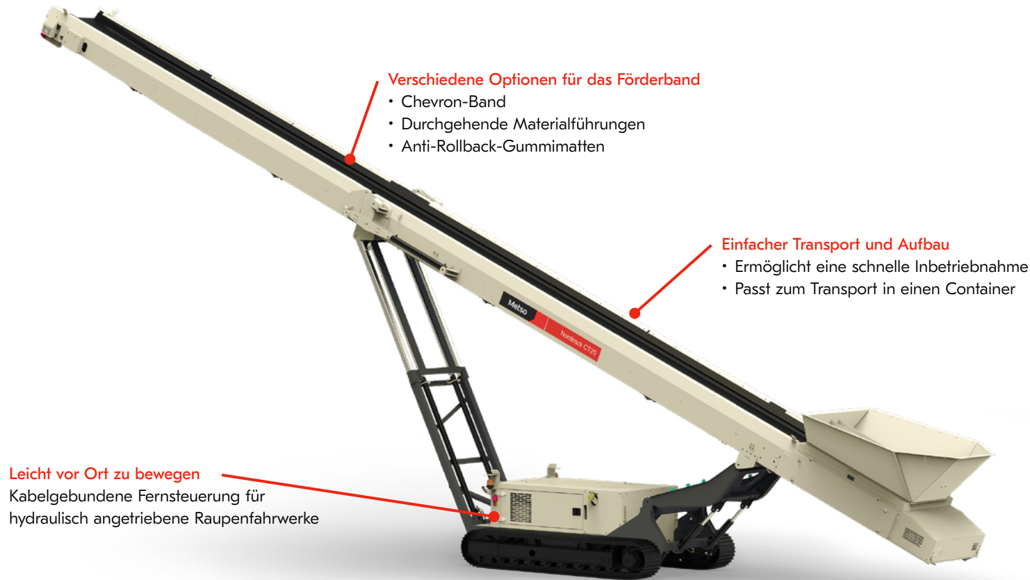
Abb.: Nordtrack™ CT20 Nicht in Nordamerika erhältlich

Die mobilen Haldenförderbänder Nordtrack™ CT20 und CT24 sind eine kostengünstige Alternative zu Radladern. Durch diese Förderbänder entfallen zusätzliche Materialbewegungen mit Radladern. Das verringert Ihre Betriebskosten und verbessert die Qualität Ihres Endprodukts.