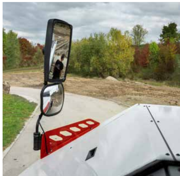
Umstehende Personen werden dank der großen Scheiben, der verstellbaren Spiegel und der Rückfahrkamera erkannt.