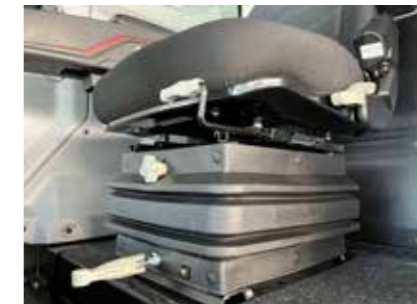
Der gefederte Fahrersitz lässt sich im Handumdrehen auf Ihre individuellen Körpermaße einstellen.