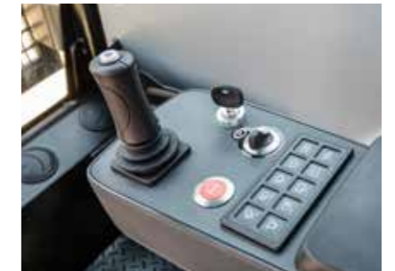
Über das Bedienpanel in der Armlehne können wichtige Fahrzeugfunktionen einfach gesteuert werden. Zudem bietet es Stauraum für Smartphone und Co.