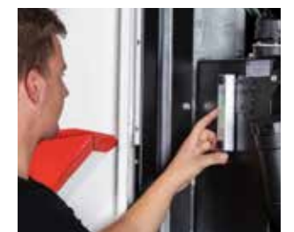
Einfache Kontrolle der Ölstände über Sichtfenster