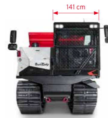
Die breite Kabine bietet dem Fahrer ausreichend Platz und Stauraum.