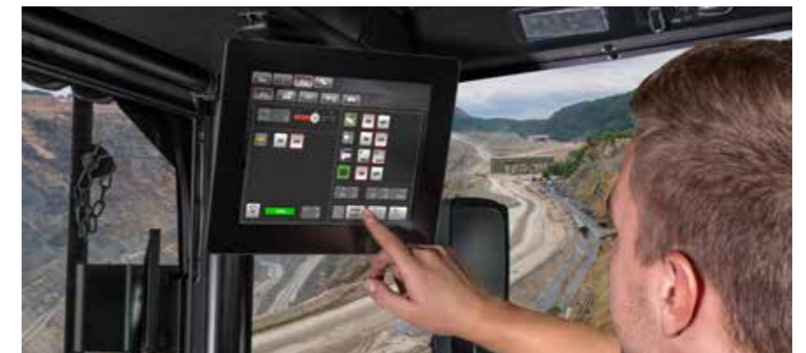
Über das 11" iTerminal mit Touchdisplay können Sie Fahrzeugfunktionen bedienen und wichtige Informationen ablesen.