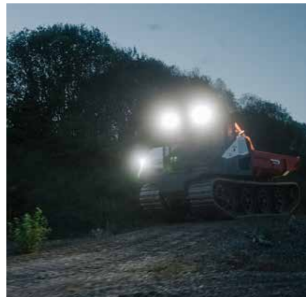
6 LED Scheinwerfer sorgen für beste Sicht bei Dunkelheit und schlechtem Wetter.