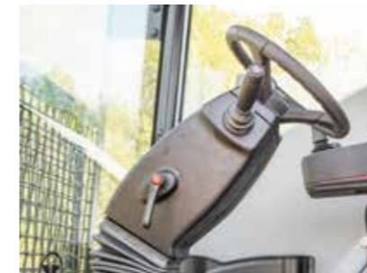
Wählen Sie zwischen dem verstellbaren Lenkrad oder dem intuitiv bedienbaren Einhand Joystick.

Die geräumige PowerBully Kabine wurde für lange Arbeitstage entwickelt: Mit dem gefederten Fahrersitz, den intuitiv bedienbaren Steuerelementen und zahlreichen Komfortfunktionen, ermöglicht sie Fahrern ermüdungsfreies Arbeiten unter herausfordernden Bedingungen.