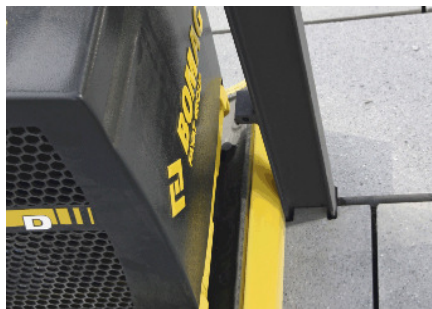
Keine Beschädigungen an Einbauten und Rändern