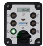
Verdichtungskontrolle COMPATROL® 2.0