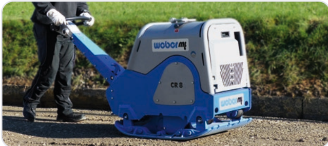
Intuitive, einfache Bedienung.