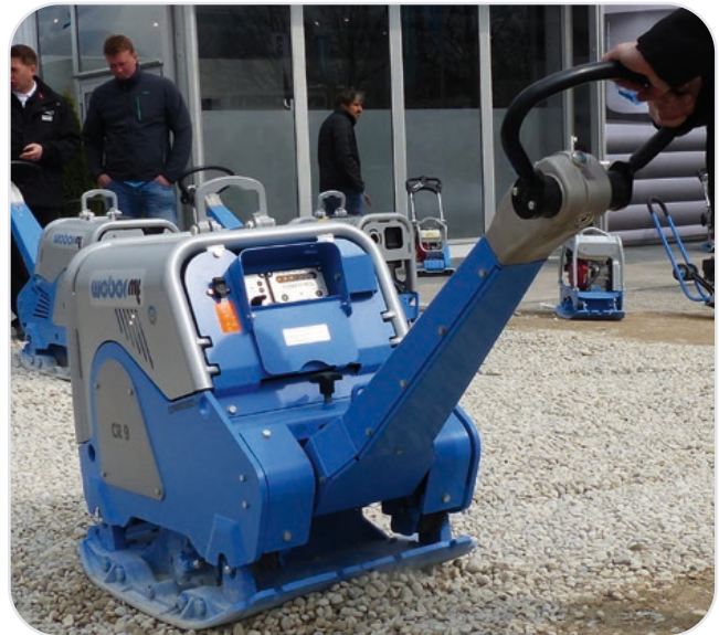
Optional lieferbar mit Verdichtungskontrolle / Motorschutz.